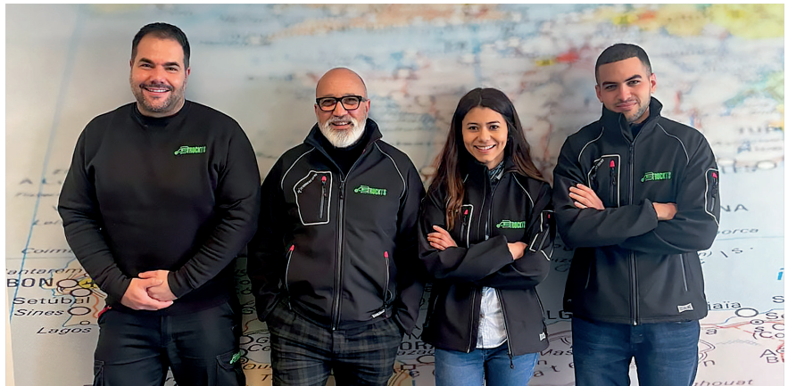
Truck-i ha conseguido duplicar su plantilla en poco tiempo y prevé volver a hacerlo en 2023.